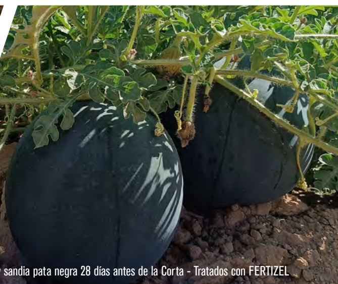
Piel de sapo y sandía pata negra 28 días antes de la Corta - Tratados con FERTIZEL